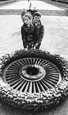
▲第2次世界大戦の慰霊祭、ウクライナ若者たちを祈るナチス戦没者慰霊祭

「野に咲く花はどこへ行く」と歌われる。アメリカン・フォークの父ビートル・シーガーの作。ペトナム反戦運動でよく歌われた。原作は「花はどこへ行った 娘が摘んだ」「娘はどこへ行った 夫を探して」「夫はどこへ行った みんな兵士になった」「兵士はどこへ行った みんな墓に入った」「墓はどこへ行った 花で覆われた」と展開する。「いつになったら分