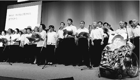
▲2019世界大会「平和の旅へ」

「核兵器の非人道性」「平和の国際ルール」と核兵器禁止・廃絶の役割「アジアの平和・安全」。5日は他