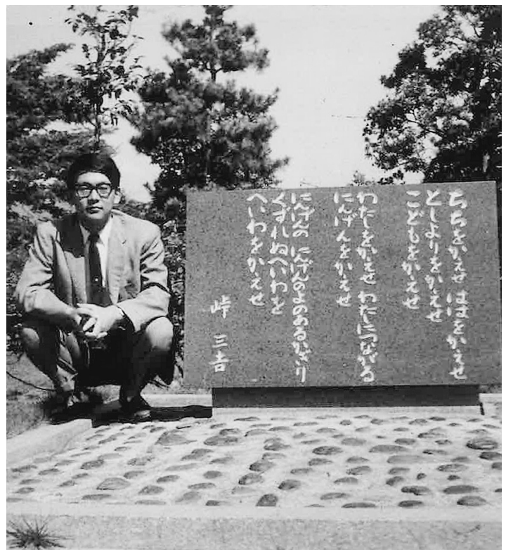
▲原水爆禁止世界大会広島で筆者(約55年前)

うに真っ赤な巨大な入道雲が立ち上がり、瀬戸内海からの朝日に映えてピンクに美しくったのを覚えていた。