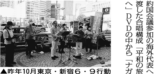
▲昨年10月東京・新宿6・9行動