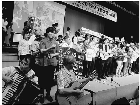
▲2019世界大会フィナーレ海外代表、会場と一緒に「we shall overcome」他を

原水爆禁止2022世界大会「テーマ」「被爆者とともに、核兵器のない平和で公正な世界を、人類と地球の未来のために」は、3年ぶりにリアルで開催。8月4日開会総会(広島県立総合体育館・グリーンアリーナ)。オンライン配信(有線)は海外からのゲストスピーカー、被爆者あいつつ。平和の波、開始宣言。5日国際会議(同)セッション