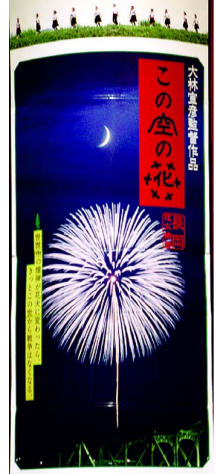
▲映画「この空の花―長岡花火物語」

「もうひとつ、ドキュメンタリー映画『広島・長崎における原子爆弾の影響』（1946年、日本で制作、フィルムを米国が没収。現在、日映アーカイブに保管）も、原爆投下で広島ではその年に14万人が亡くなったことには触れていても、その後の膨大な被爆者の数には触れられていません。結局、原爆投下が平和を招いた。だから、核はこれからも平和の時代をつくるために活用すべきだというストーリーです。（4面につづく）