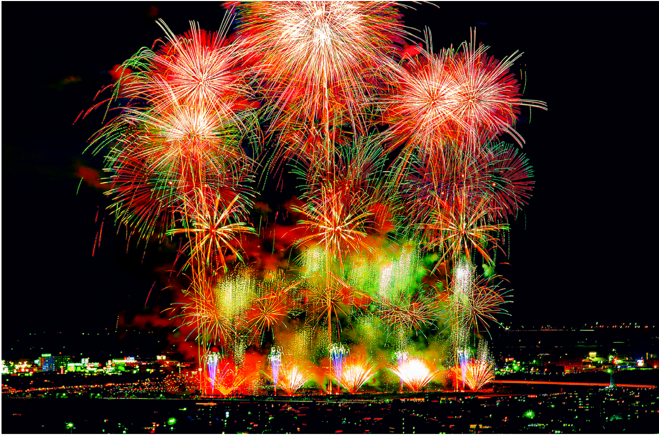
▲「正三尺玉」や打ち上げ幅約2kmにも及ぶ長岡まつり大花火大会（長生橋下流信濃川河川敷）