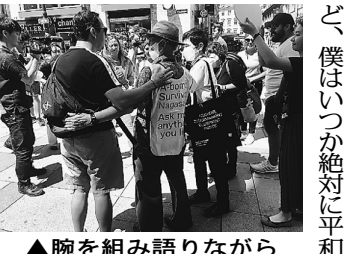
▲腕を組み語りながら

真に撮る人々で賑わうこの教会前に、グレースの帽子とシャツとスカーフとメガネと、サツ