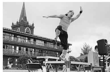
▲下半身強化にソールン節

めて学んだソールン節の踊りは、正調秋田県わらび座ソールン節が、信州田楽座ソールン節に変化したものでした。それは、よさこいソールン節が世に登場する10年前の話ですが、あの理由によって、態勢を非常に低く構えることから、「地を這うソールン節」と言われ、岐阜県恵那地方で圧倒的な支持を受けていたのです。