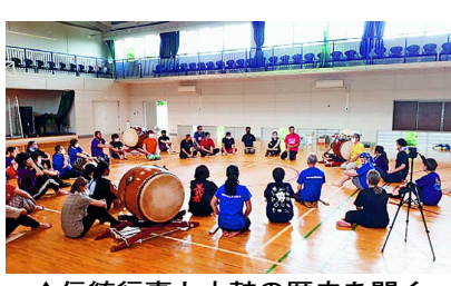
▲伝統行事と太鼓の歴史を聞く