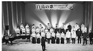
▲C57も迎えて「白鳥の歌」

は初めてのこと。第一部 広島合唱団は明日への希望を感じるステーション。団の愛唱歌「ローズ」をはじめ優しいうたごえが流れる。第二部は広島を支える3人のピアニストによる演奏、トイピアノ2台を使った「クッキングメロデー」が愛らしく、六手連弾での「トルコ行進曲」「リベルタンゴ」のダイナミックな演奏に胸が躍った。3人のピアノ以外のパフォー