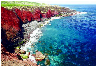
▲噴火後の、神着地区

26日午後帰りの船の中 で、参加したみなさんにア ンケートを書いていただき ました。異口同音に「また 三宅島に戻りたい!」充 実の「学ぶ会」は本当に楽 しかった!」の感想をいた だき大成功の「学ぶ会」を 終えることができました。