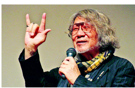
▲世界共通の手話“I love you”を示す大林宣彦監督（2014年）

大林監督（1938―2020年）『転校生』時をかける少女』『花筐』は語った。芸術は夢や理想を語るもの。9条も、