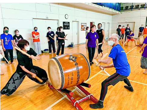
▲「表打ち」、「裏打ち」を学ぶ